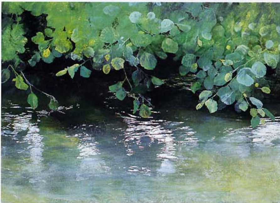
Estanque . 2005. 73X100 cm.