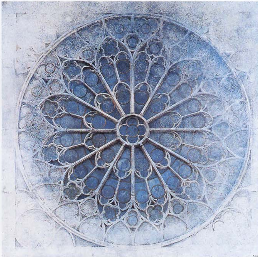
Vitrail. 2005. 100X100 cm.